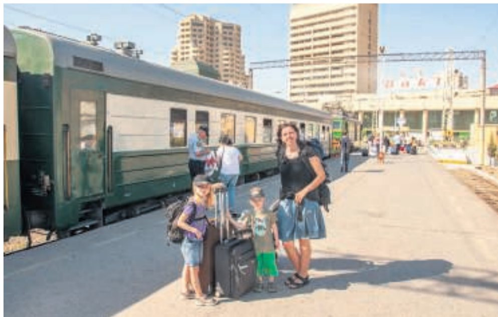
Netop ankommet til Baku med nattoget.

I Egypten kan du tage lokaltog hele vejen fra Gizas pyramider i nord til Luxors templer og kongegrave, inden sporet ender lidt før Aswan-dæmningen i syd. Jernbanesporet løber lige ved siden af Nilen hele den lange vej.