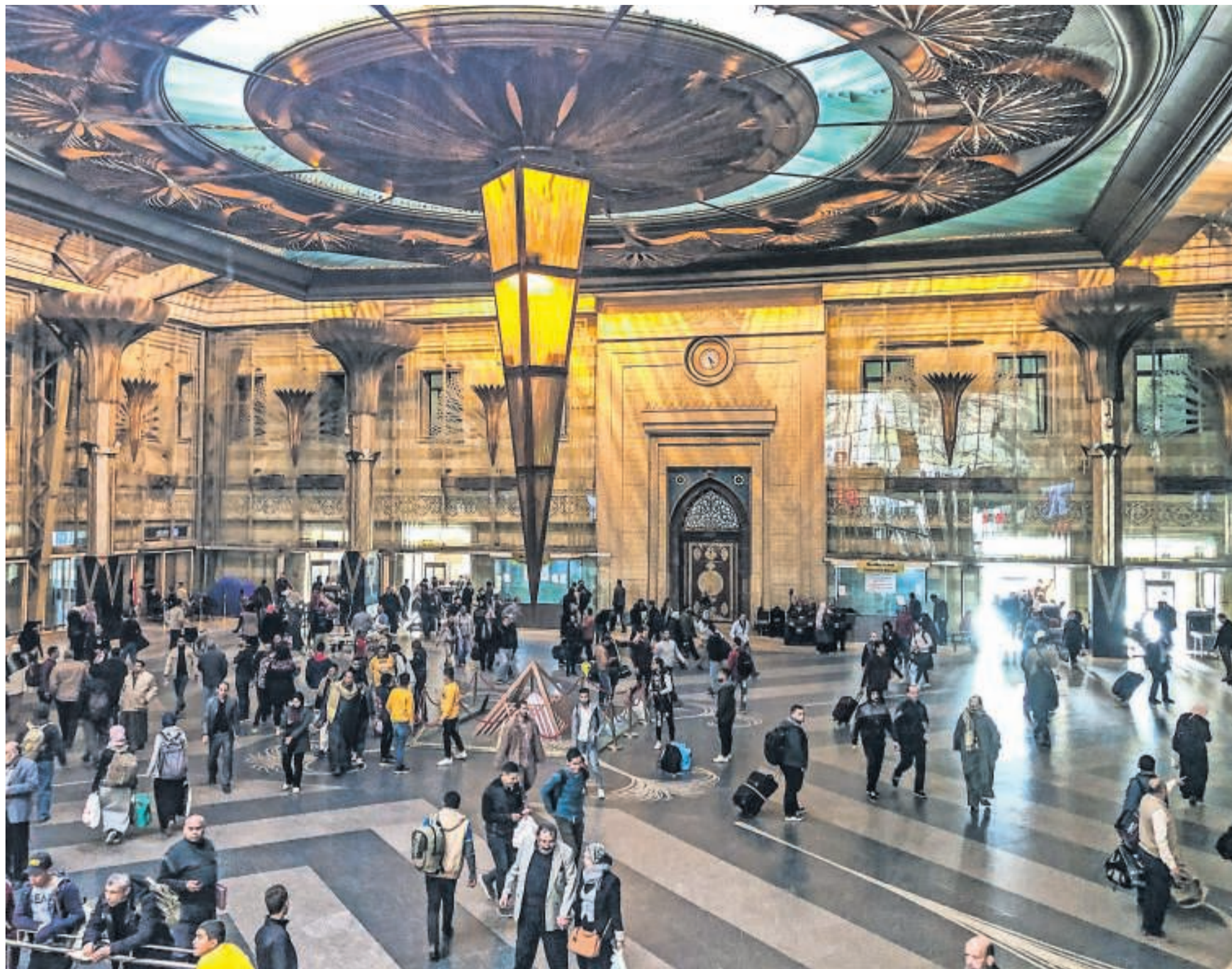
Kairos kæmpemæssige Ramses-togstation.