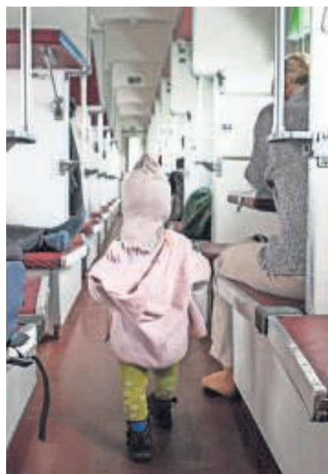
På vej gennem en andenklasses-togvogn mellem Vilnius og Minsk.

an deres håndtrukne kærre med enorme træhjul uden dæk. Calcutta er nemlig en af få byer i verden, hvor denne specielle transportform fortsat eksisterer.