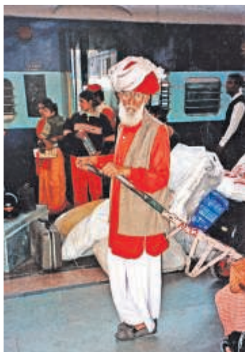
Drager foran et af Indiens mange gamle tog.

Turen mellem storbyerne Chennai og Calcutta tager knap 30 timer. Ved endestationen venter utallige rickshaw wallahs for-