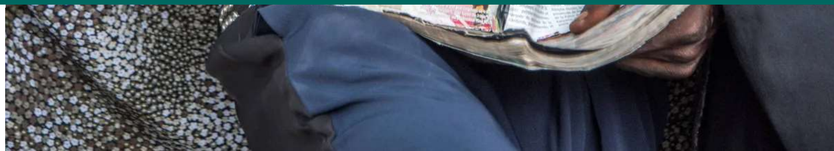
Velklædte levemænd på kirkegården i Gombé.