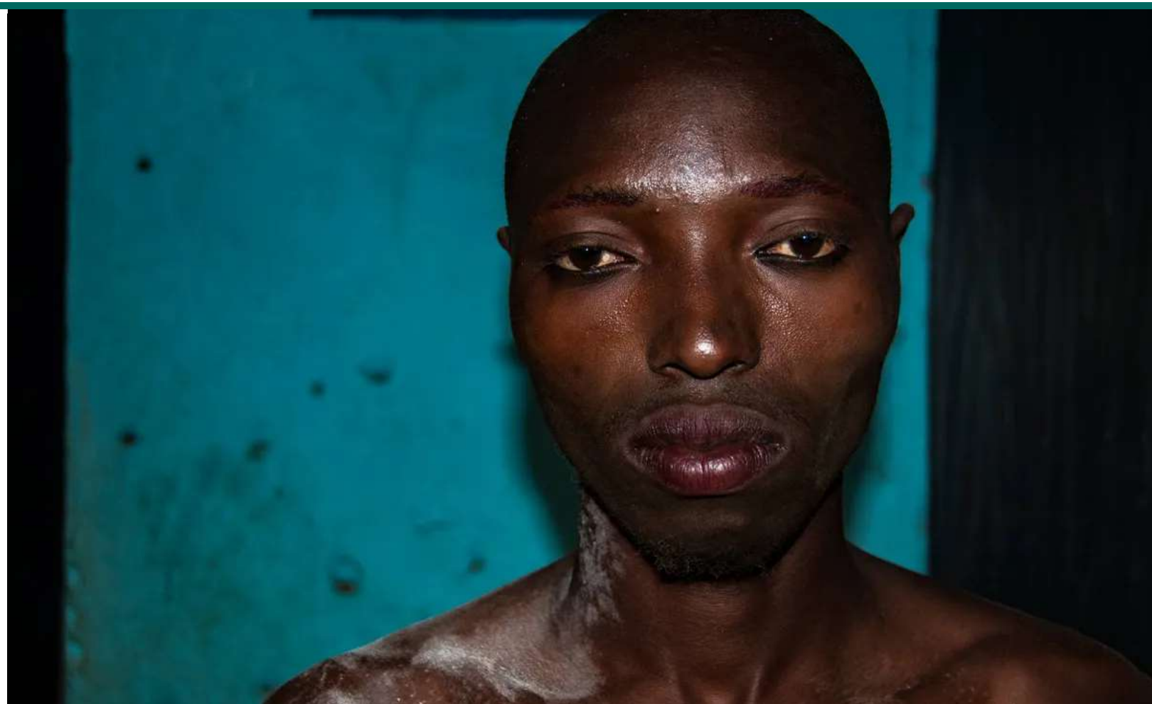
Poro-folket er et hemmeligt broderskab, der kun holder til i Elfenbenskysten, Liberia, Guinea og Sierra Leone.

Poroerne tilbeder djævlén og er kendt for at nedkalde tabu og forbandelser over folk fra de omkringliggende samfund. Der er forskellige gradueringer af Poroerne: fodfolket, krigere, fetichpræster og djævlén. Poro-djævlén adresserer nogle gange udvalgte stammebrødre gennem et træror kaldet en bull-roarer – han viser sig dog kun sjældent offentligt, og mange af de menige sektmedlemmer har aldrig set ham