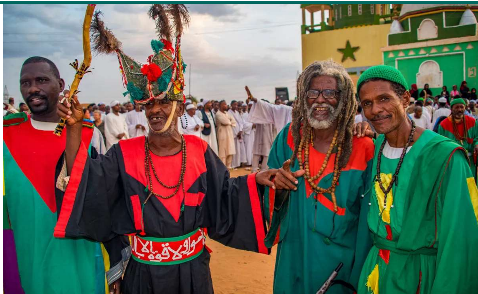
Gæstfrie lokaleinviterer med til trancedans.

Det vigtigste ritual er, når dervisherne snurrer. Mens tilskuere slår på tromme og synger »la Illaha Illallah«, forfølger dervisherne målet om at opnå indre ro og rense sjælen ved at dreje rundt og rundt, som var de besatte. Flere af dem kolliderer udmattede på jorden, når ritualet er tilendebragt.