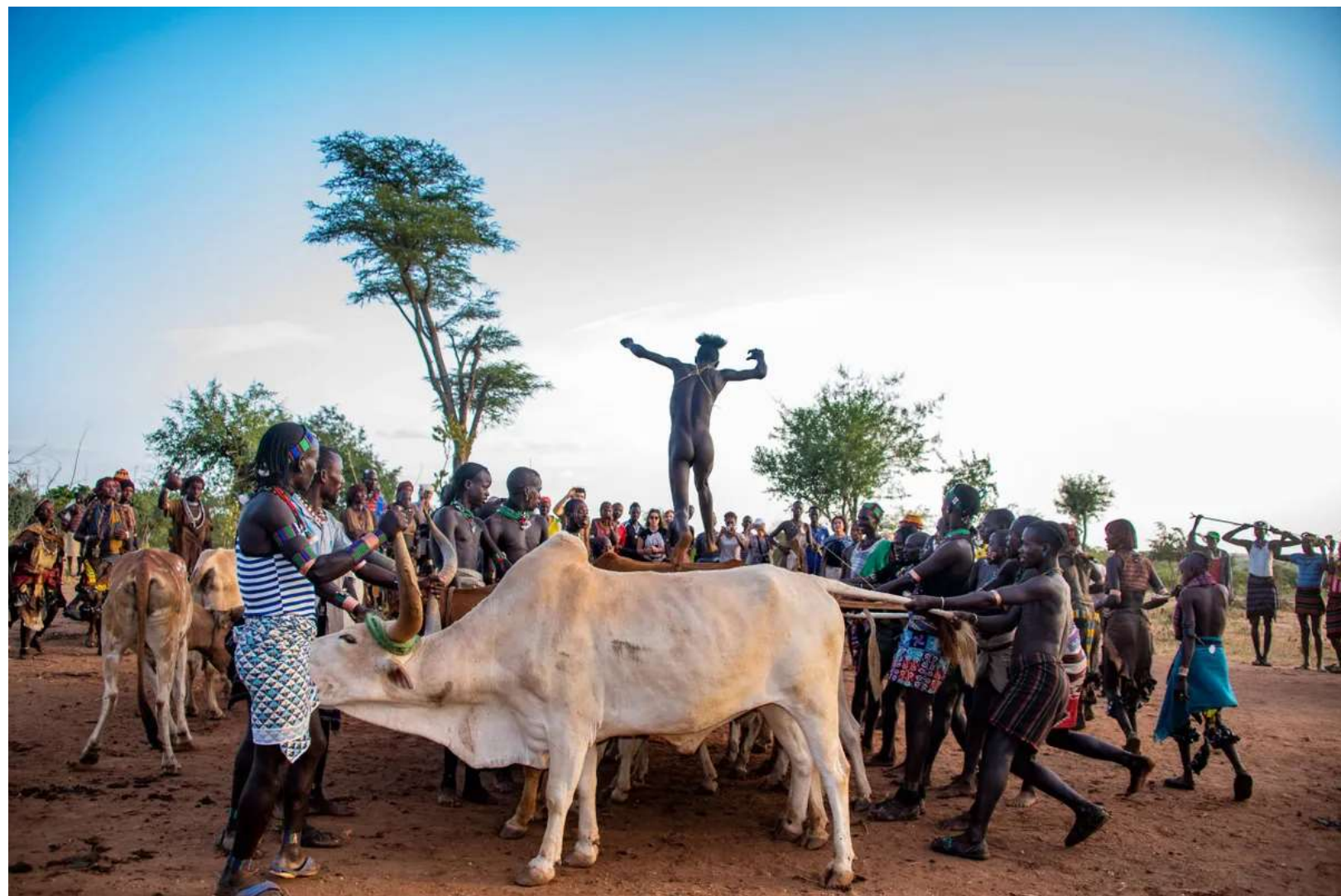
Dagens konfirmand i spring over otte tyrerygge.