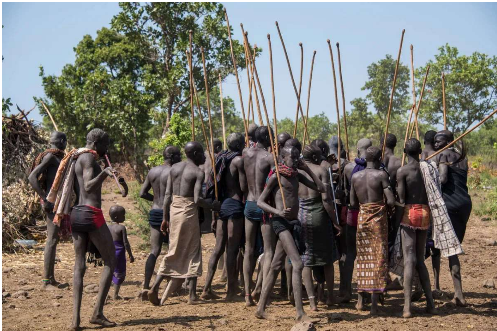
Unge krigere med spidse stave gør sig klar til at kæmpe.

Mursi-folket afholder ceremonier ved særlige lejligheder som bryllupper, navngivning og den såkaldte halsveneceremoni. Det får ud på, at en tyr skydes i halsen med bue og pil, hvorefter der tappes et par liter blod fra tyren, som udvalgte medlemmer af stammen drikker. Få gange om året afholdes desuden den såkaldte donga som er en særlig stavkampsceremoni.