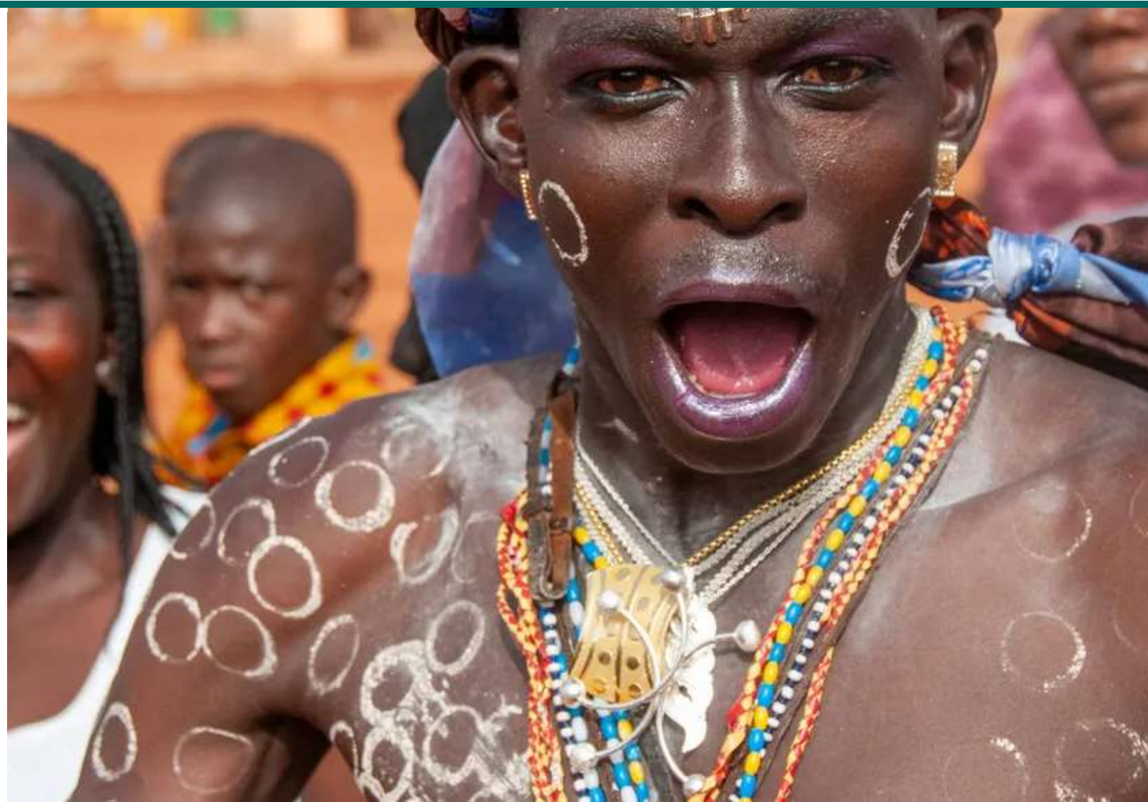
Poro fra fodfolket ved den offentlige ceremoni.