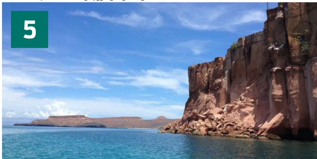
Eroderede lyserøde sandstensklipper giver Espiritu Santo-øen et karakteristisk udseende.