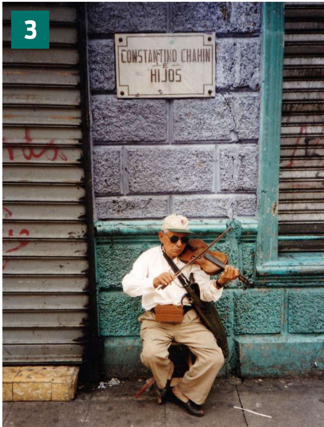
Gademusikant i hovedstaden San Salvador.

Udover hvalhajer byder havet her på papegøjefisk, junkergylte, fanefisk, røkter, skildpadder og delfiner. I himlen over dem flakser pelikaner, sne- og blåhejrer, gribbe og kolibrier. Har du brug for at stille sulten, når du kommer i land efter din eksotiske udflygt, så prøv en omgang Tamales – grillet majs med mayonnaise og chili. ■