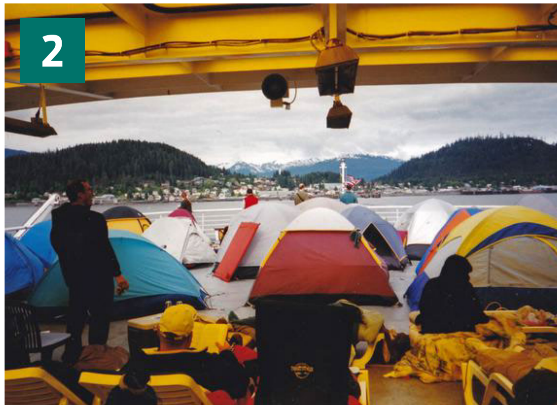
På Alaska State færgen Columbia kan man slå sit telt op på dækket.