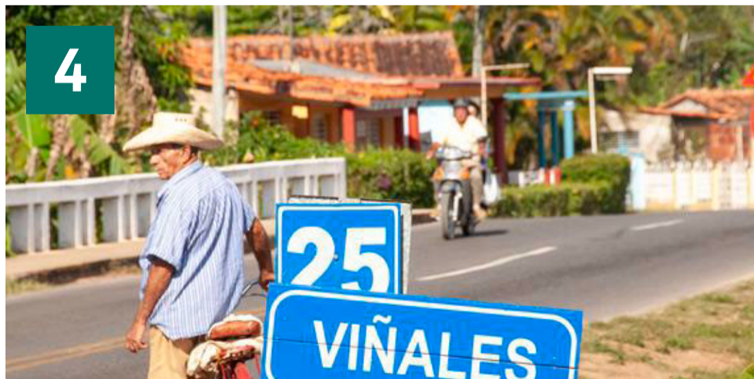
Trafikken er sparsom omkring hyggelige og frodige Viñales.