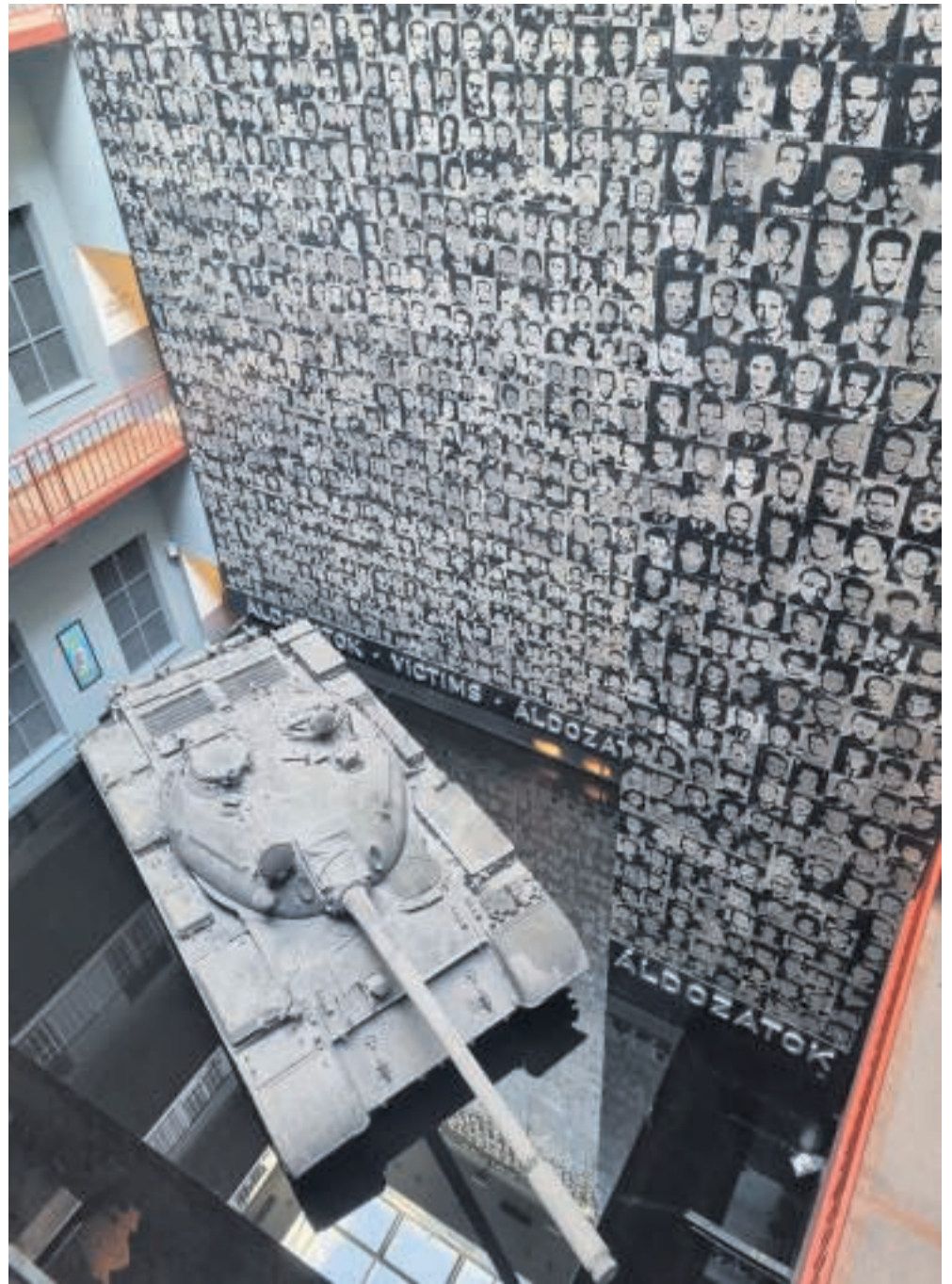
I Terrorens Hus-museet beskrives mange af de rædsler, som landets befolkning var udsat for under anden verdenskrig, og mens man var underlagt kommunistisk styre.

Mest kendt er måske den lillebitte mini-tank, som er vendt mod Ungarns parlament. "Ruszkik haza!" ("Tag hjem russere!") står der på siden af tanken. Kunstneren har dog valgt at lade kanonen pege skråt nedad for at symbolisere, at revolutionen nu er afsluttet.