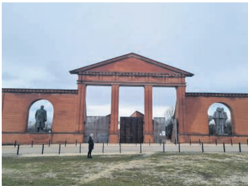
Stalins støvler, som ses i baggrunden, blev symbolet på den ungarske revolution, efter at byens statue af Stalin blev væltet, og kun støvlerne stod tilbage.

Praktisk info: Det meste af ghettoen er i dag jævnet med jorden, men går du gennem porten ved Király utca nr. 15 og ind i baggården, kan du se den sidste tilbageværende del af muren. Besøget kan let kombineres med et visit på det nærliggende gårdplads-søndagsmarked Gozsdu-udvar.