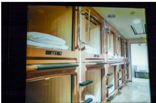
Der er ikke meget plads i de japanske kapselhoteller, men der er normalt fine fællesfaciliteter tilknyttet.

Overnatning: Hostels fås fra 200 kr. pr. nat for et dobbeltværelse. Hotel eller ryokan (traditionelle hoteller med sutsko, sivmætter, kimonoer og madrasser på gulvet) fås fra ca. 300 kr. pr nat for et dobbeltværelse. Kan bookes hjemmefra eller i turistinformationen på landets togstationer. Kærlighedshoteller bookes som oftest på timebasis, og både de og kapselhotellerne benyttes næsten udelukkende af japanere. Et kapselhotel koster 100-150 kr. pr. person pr. nat.