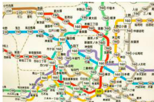
Tokyos metrorutenet er mindre lineært end en skål kogt spaghetti.