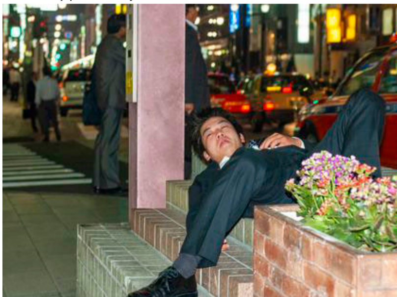
En ung japaner er dejset omkuld efter for mange fyraftensøl.