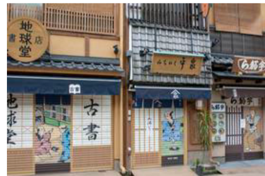
Huse opført i traditionel stil i et af Tokyos ældre kvarterer.