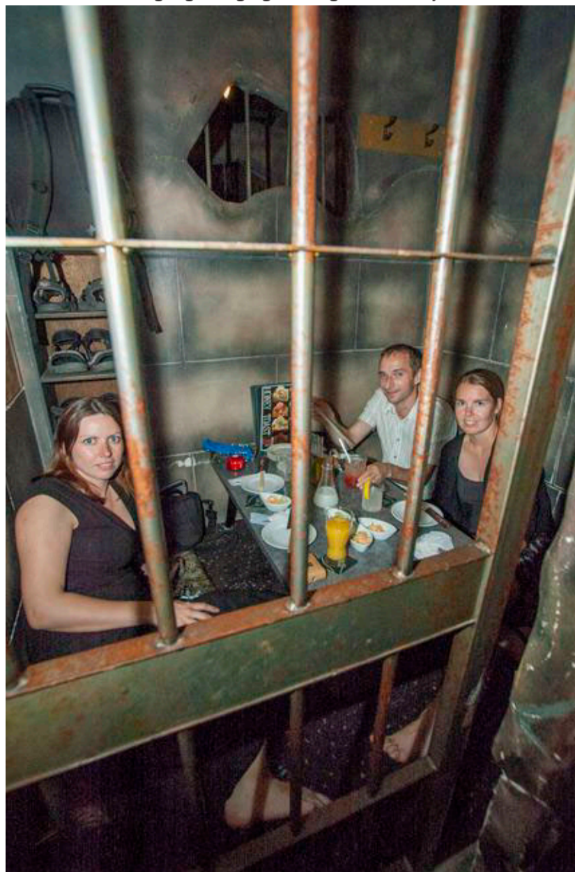
I vores celle på konceptfængselsbaren Lock Up.

OL 2021 finder sted i Tokyo. Desværre bliver det uden internationale tilskuere, men forhåbentlig åbner landet snart op igen, så du både kan se sport og komme på fængselsbar.