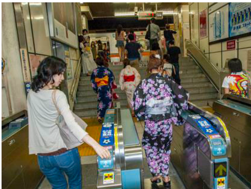
Festklædte japanere i Tokyos metro.