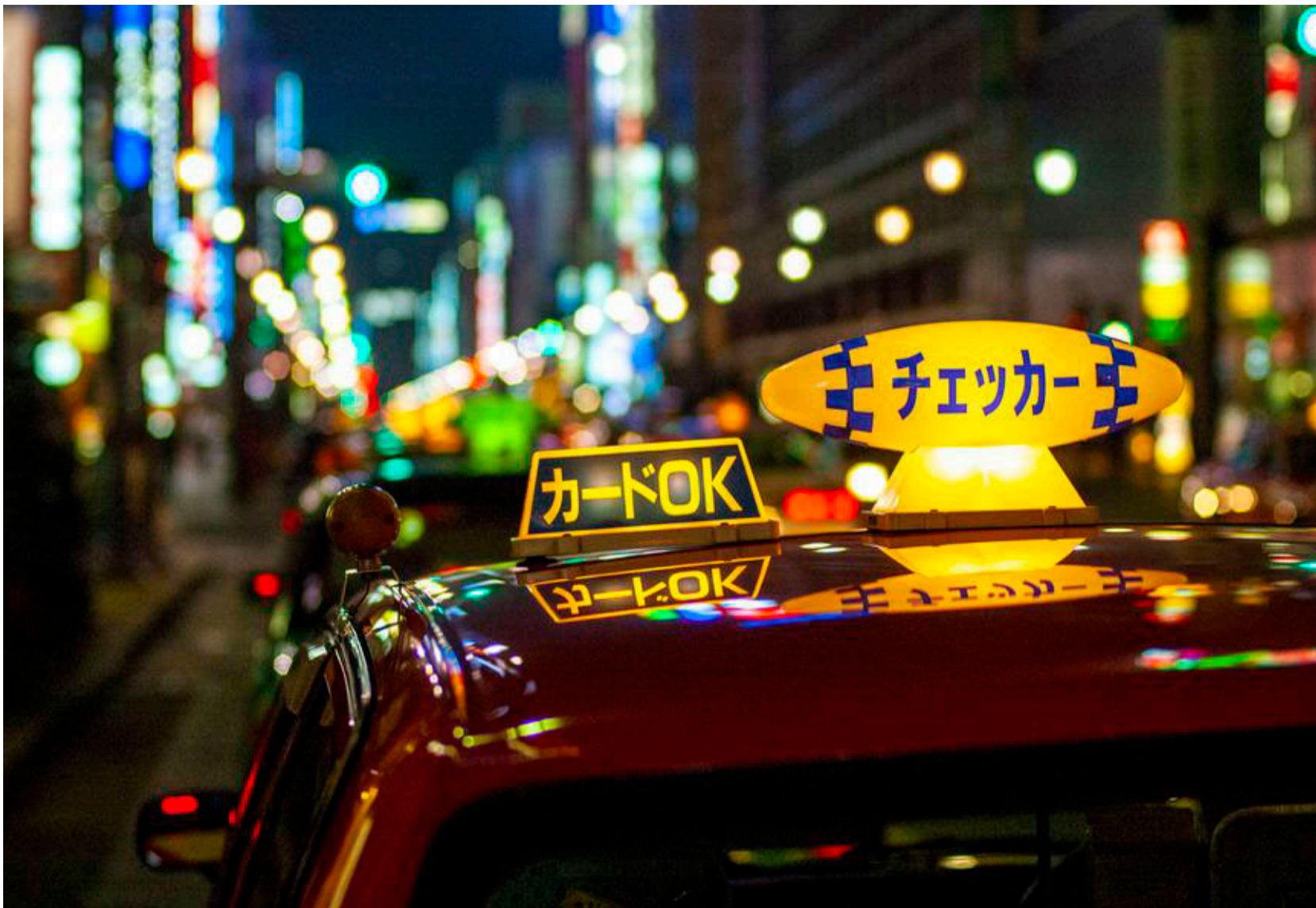
Taxaer linet op i Ginza, Tokyo mondæne shoppingcentrum.