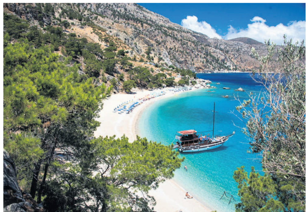
Apella-stranden på Karpathos' østkyst figurerer ofte på lister over landets - og verdens - flotteste strande.

Her, i en ganske anden verden, stod den på udspring fra båden og snorkling med børnene i noget af det klareste vand, jeg kan