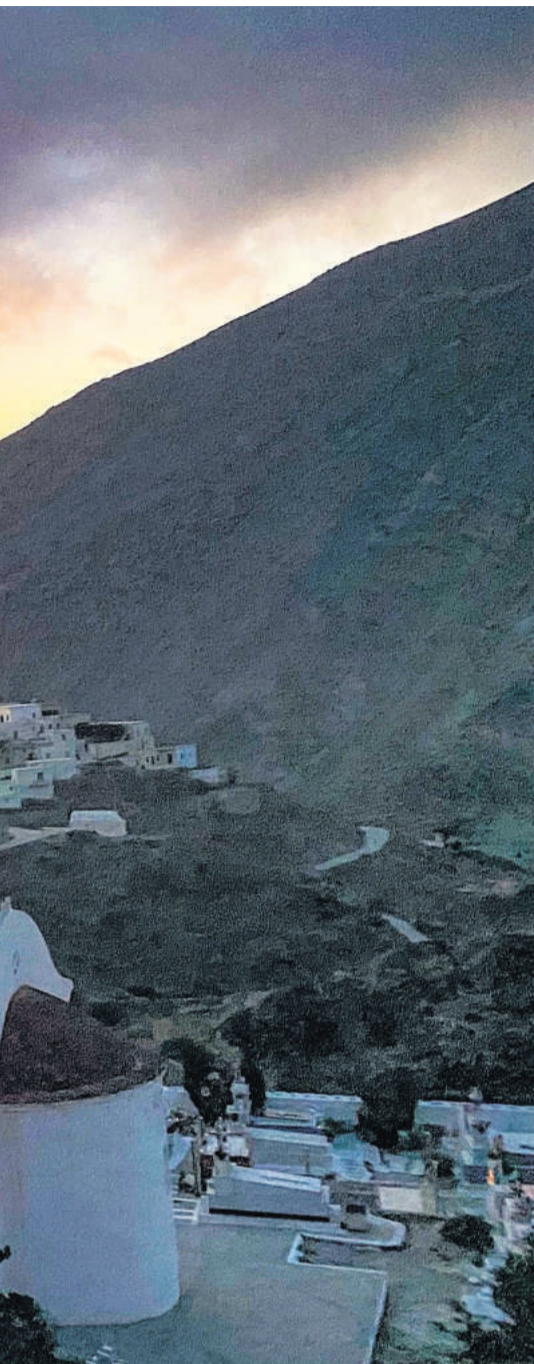
Bjerget Olympus og byen Olymbos set inde fra dalen.

huske at have set. Uden andre bekymringer end dem, ægteparret altså nu bibragte os forud for vores tur til det bjergrige nord.