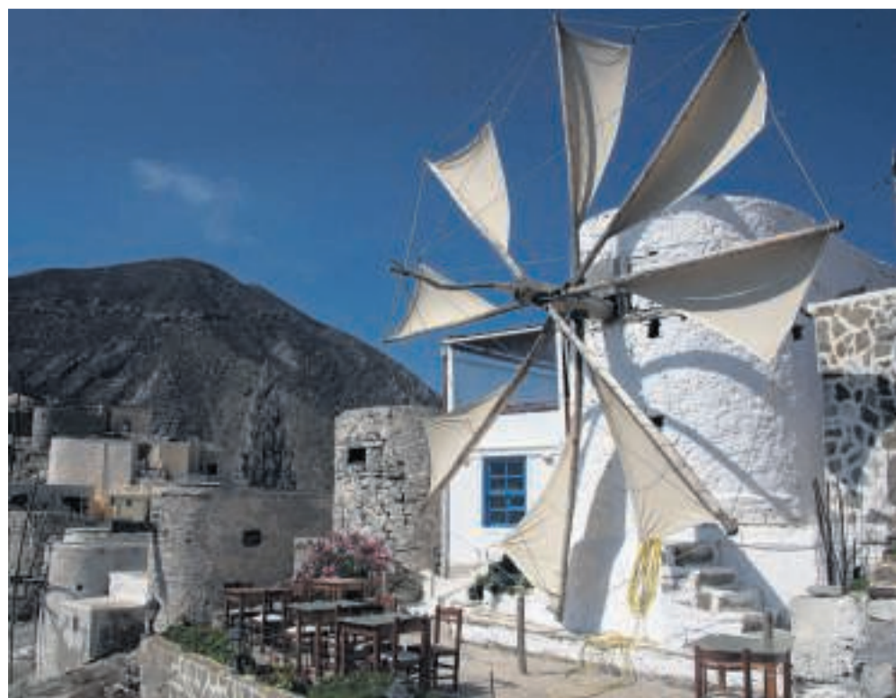
Mange af Karpathos' gamle vindmøller restaureres til ære for turisterne.

Til sidst når vi endelig frem til den afsondrede nordvestkyst, hvor et af de mest ikoniske syn i hele Grækenland møder os. For enden af hårnålesvingsvejen er bjergtoppen overstrøet med farverige huse med flade tage, der som i et amfiteater er bygget i terrasser langs bjergets top.