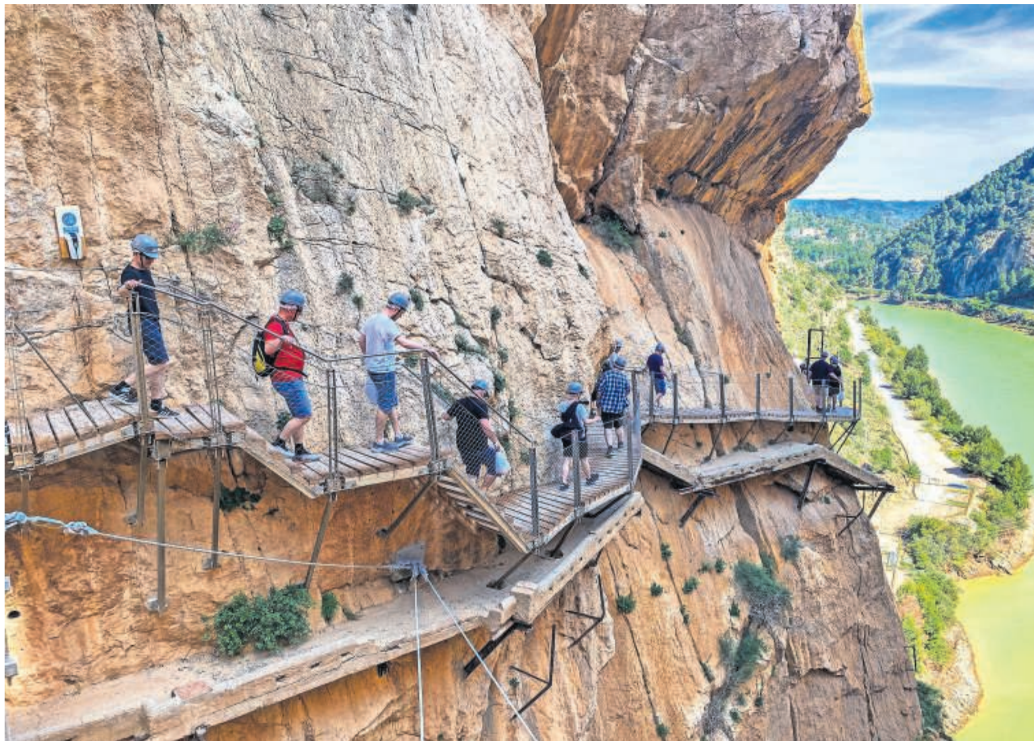
Den nye gangbro er bygget lige over den gamle, men er, som det fremgår, noget mere moderne og sikker.

klar til at skære en frisk skive skinke. Er man mere til grillede lækkerier end traditionel tapas, byder byen også på adskillige restauranter der serverer grillet kød - de såkaldte asadors.