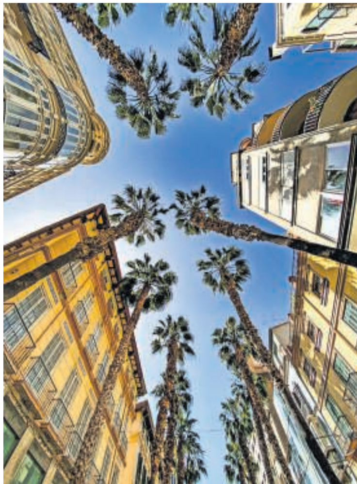
Den gamle by byder på palmer og smukt restaurerede huse.

Rejsetidspunkt: Málaga har mange solskinstimer og byder normalt på behagelige temperaturer i perioden helt fra marts til november. Om foråret og efteråret svarer temperaturerne nogenlunde til normal dansk sommer, og på dette tidspunkt er der desuden færre turister end i højsæsonen.