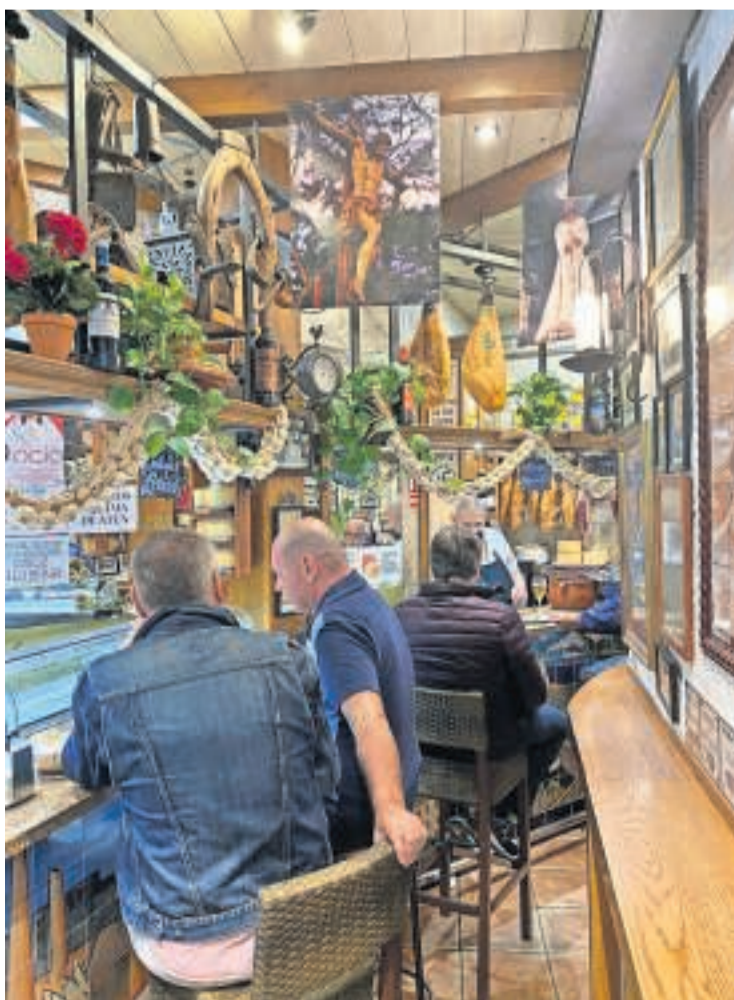
Der ligger tapas-restauranter overalt i Málagas gamle by.

Praktisk: Det koster 9 euro (cirka 68 kroner) at besøge Picasso-museet og 4 euro at besøge fødestedsmuseet Museo Casa Natal. Begge steder kan bookes online og er lette at finde på Google Maps.