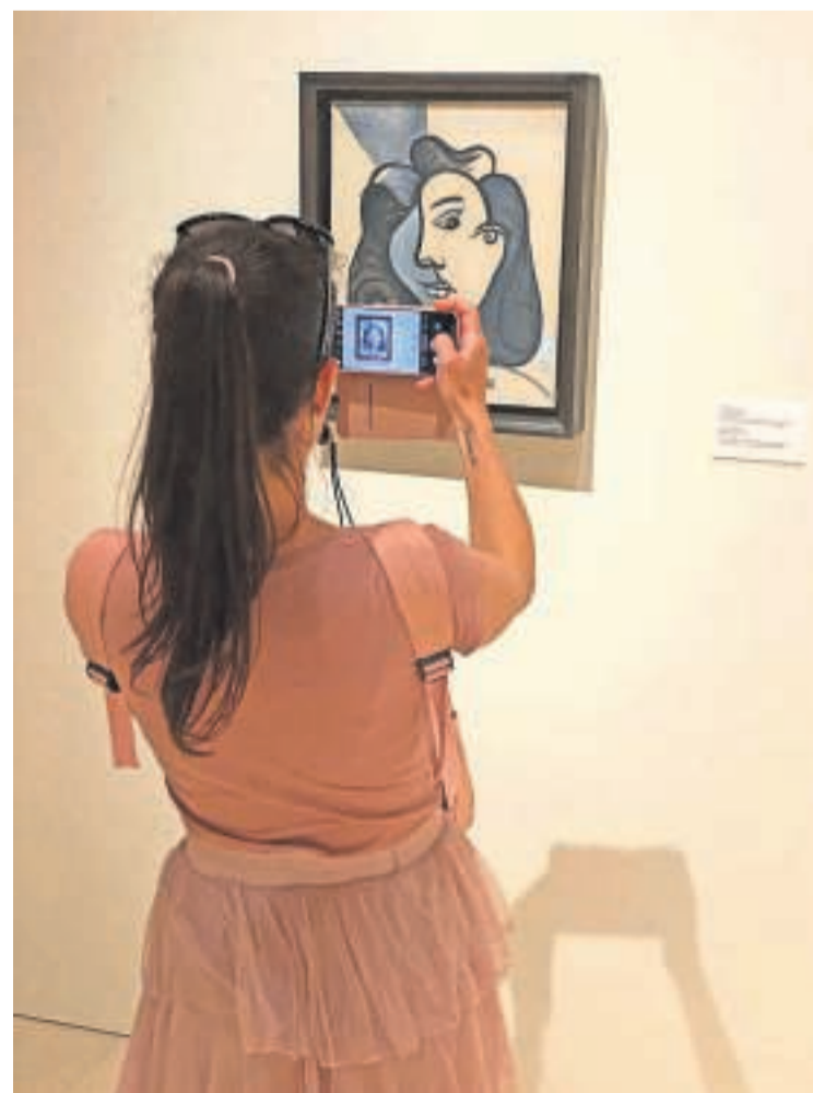
Picasso-museet i kunstnerens fødeby.