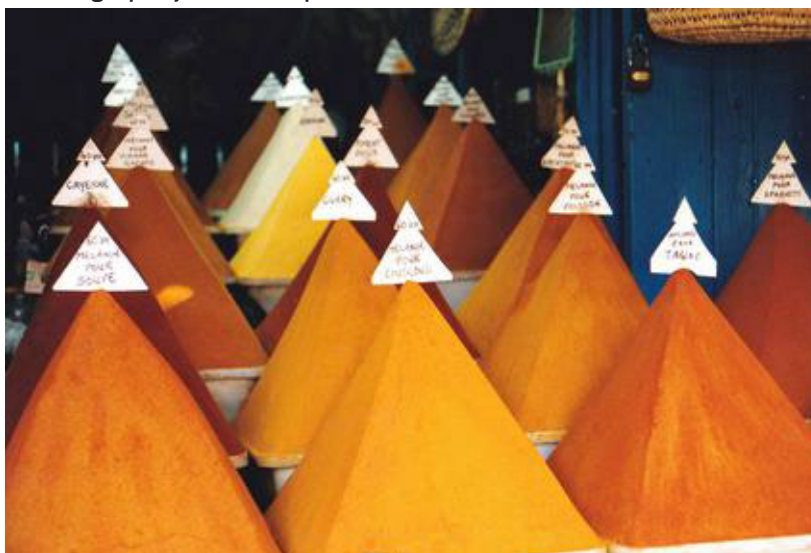
Krydderipyramider i souken i Essaouire.