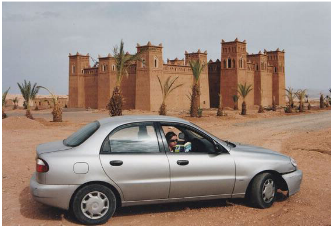
Der holdes pause i ørkenlandskabet foran en traditionel kasbah.