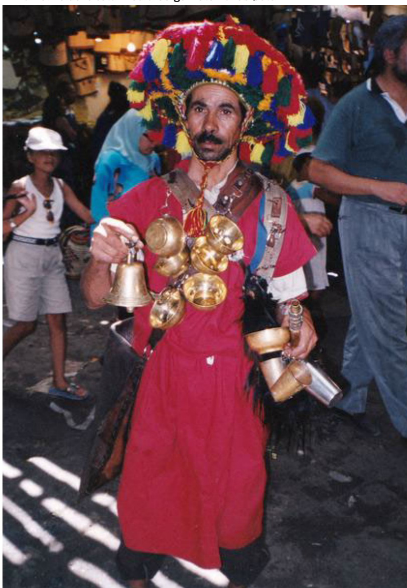
Vandsælger på Djema Al-Fna-pladsen i Marrakech.