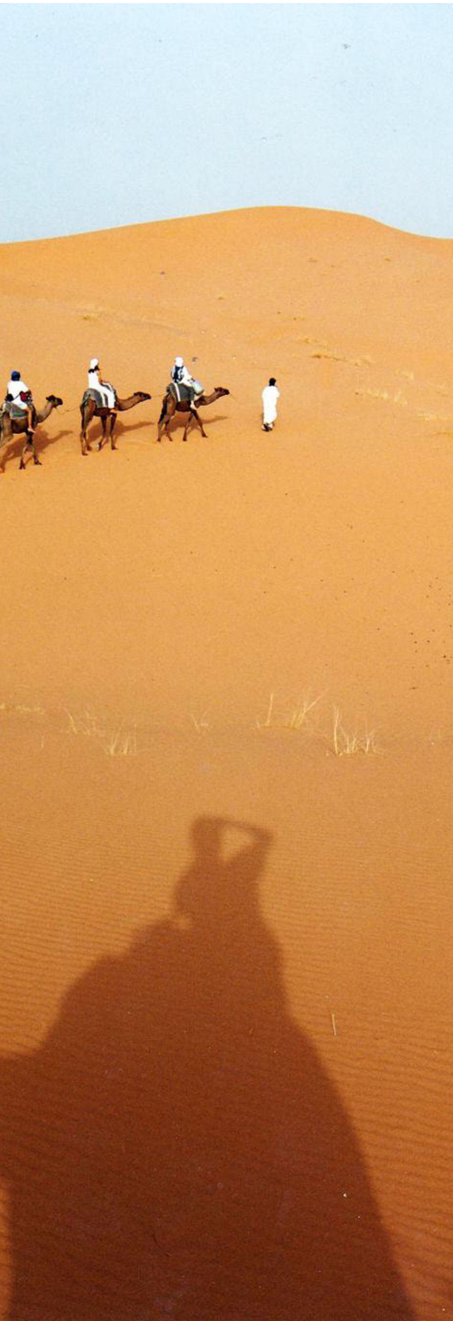
Lille kamelkaravane set fra skribentens kamel.