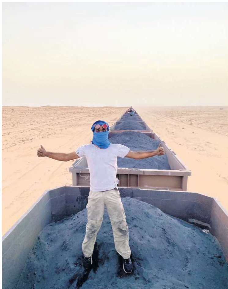
Jernmalmstoget i Mauretanien er et af verdens længste tog. Nogle gør turen oppe i malmvognene.

Sahara er verdens største varme ørken. Ørkener defineres ud fra, at der ikke må falde ret meget nedbør, og derfor tæller den kolde antarktiske polarørken - som er markant større - også med. Der er målt temperaturer op til 58 grader i Sahara. Natteremperaturer kommer nogle gange ned under frysepunktet.