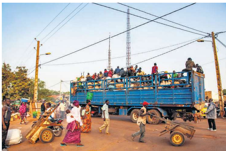
Markedet i Sikasso, Mali, sommer en tidlig morgen af aktivitet.