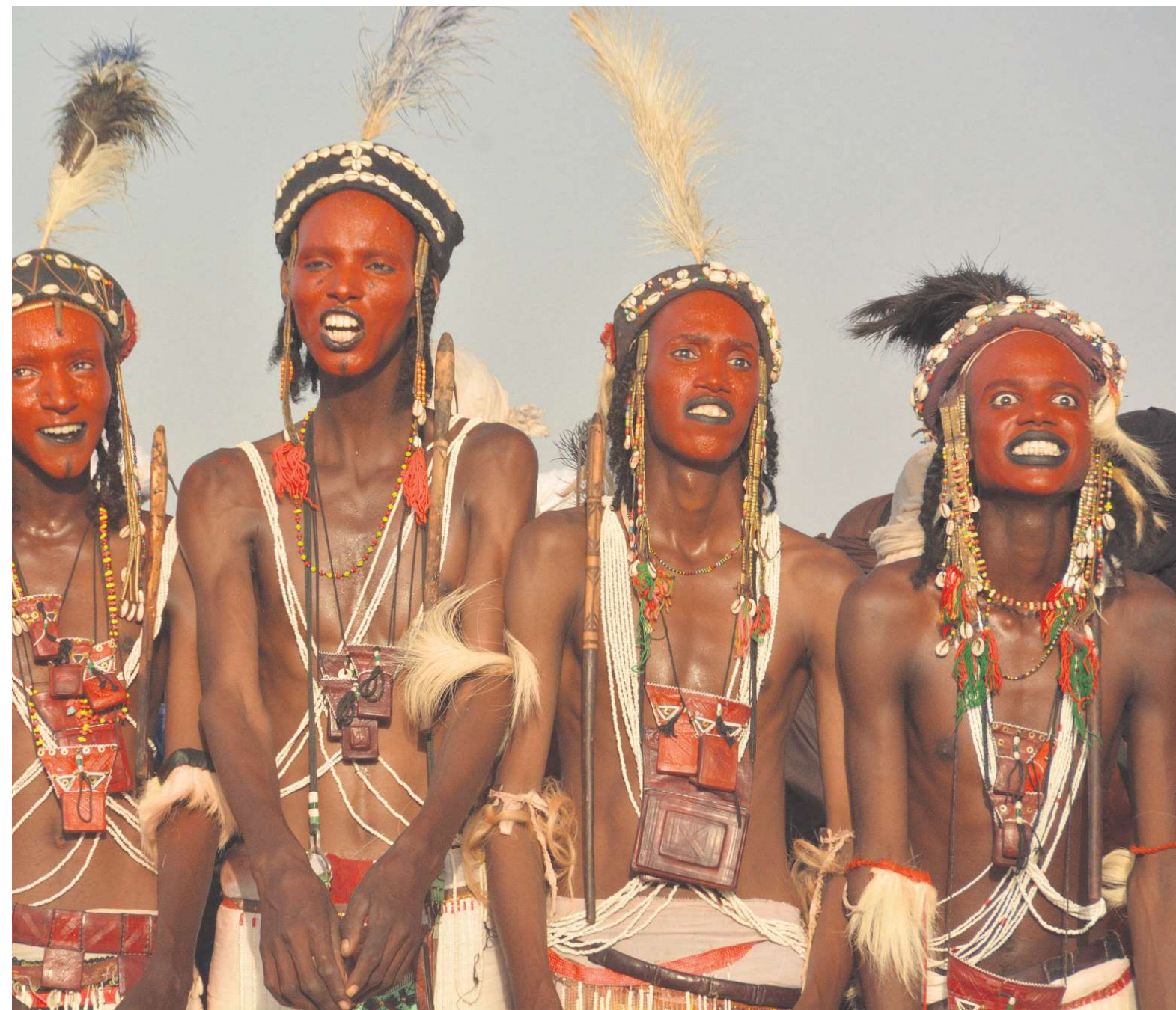
Gerewol-festival i Niger. Hvidt er godt, så deltagerne spærrer øjnene op og viser deres tandsæt frem.