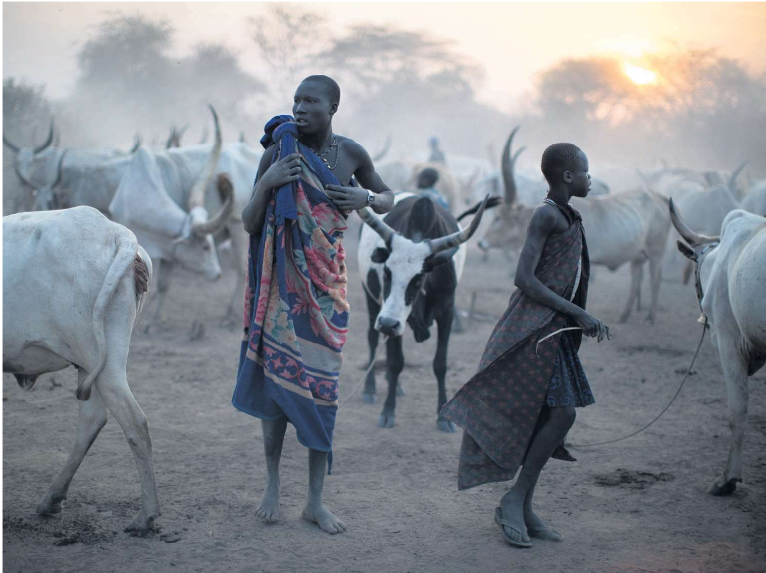
Mundari-folket i Sydsudan er nomader og lever af og med deres langhornede køer.