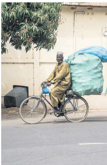
Tungt læsset cykel i N'Djamena, Tchad.

Længere sydpå er byen Bobo-Dioulasso kendt for en årlig musikfestival samt for dens mange barer med live-musik og for den nærliggende naturpark Sindou Peaks.