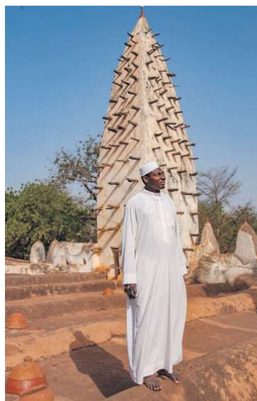
Moske i den såkaldte "mud brick architecture" i Bobo-Dioulasso, Burkina Faso.

Byens Grande Mosque er desuden endnu et fremragende eksempel på regionens såkaldte "mudder-murstens-arkitektur". Har man mod på at rejse længere ud i landet,