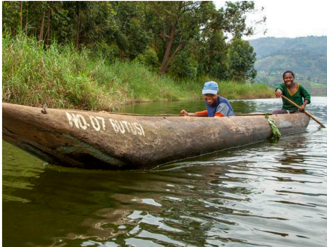
Transporten på Bunyonyi-søen foregår i udhulede træbåde.

Efter yderligere et par nætter på min hyggelige ø-camp forlader jeg til sidst Ringenes Herrelandskabet og det sydlige Uganda. Herfra leder en ny motorcykeltaxa og et par minibusser mig