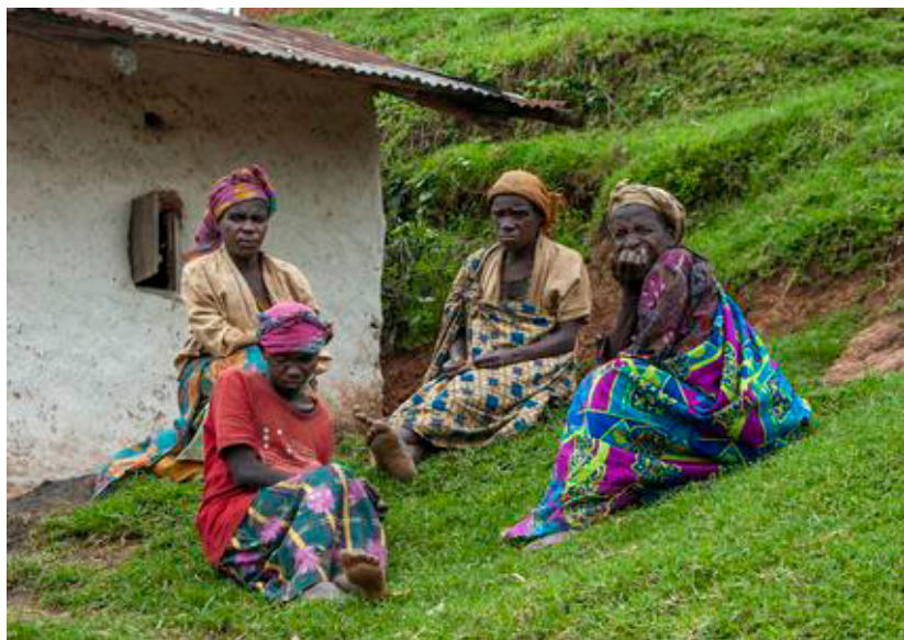
Lokale pygmækvinder har taget turen ind til markedet i Kyevu.