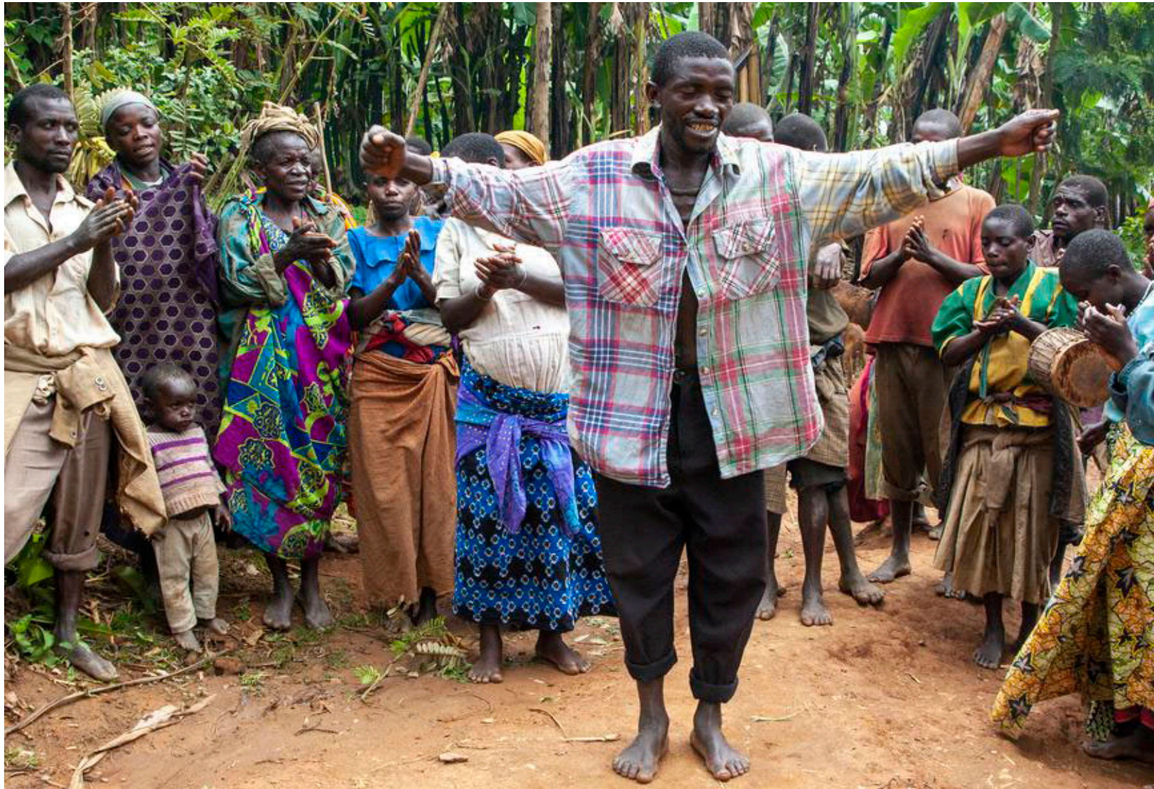
Pygmæernes danseopvisninger i landsbyen vil næsten ingen ende tage.