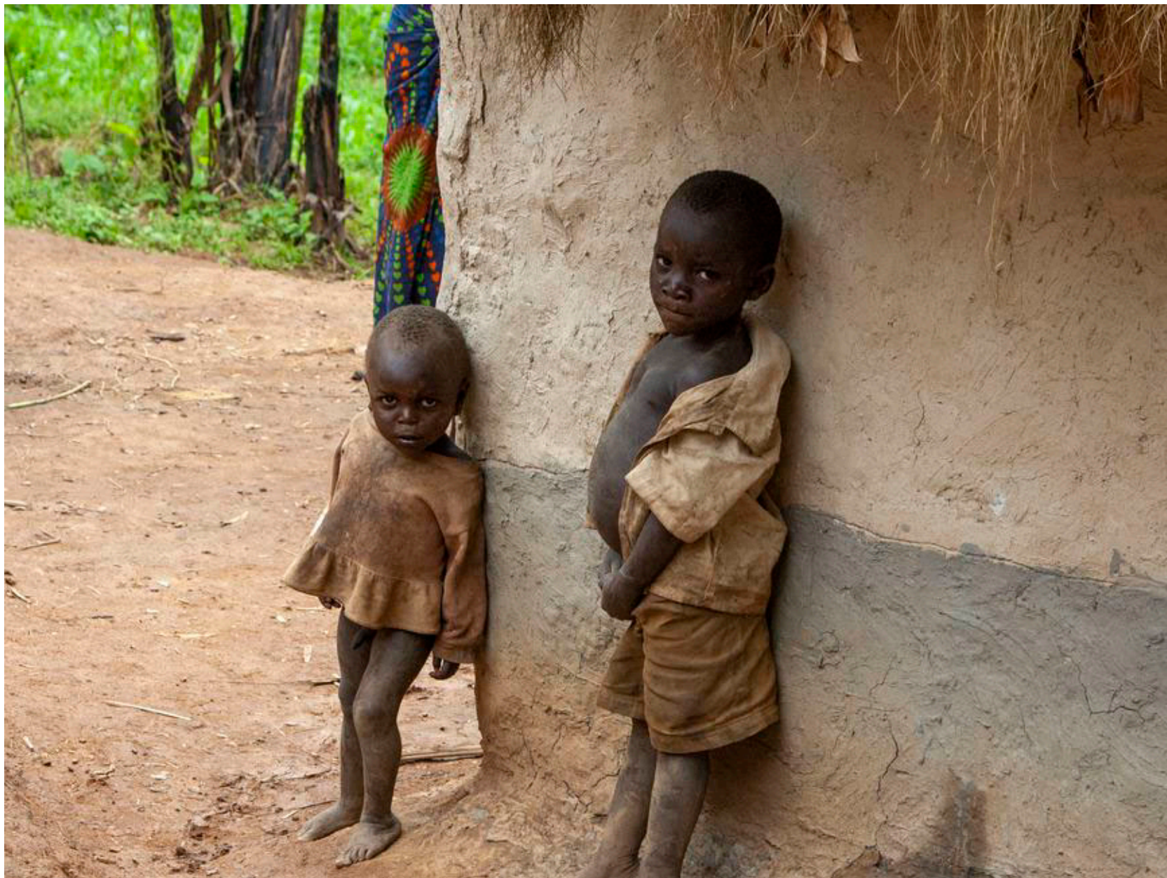
I pygmælandsbyerne i Kabale- og Kisoro-distrikterne kan man få et fint indblik i hverdagslivet.