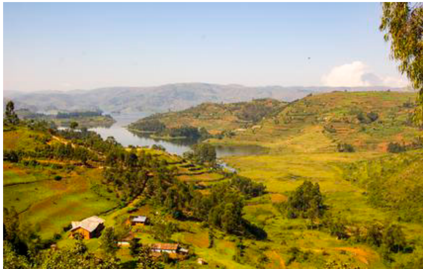
Området omkring Lake Bunyonyi ligner noget fra Ringenes Herre og man forstår hvorfor landet kaldes for "Afrikas Schweiz".